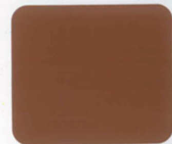
Tropical Brown 2145